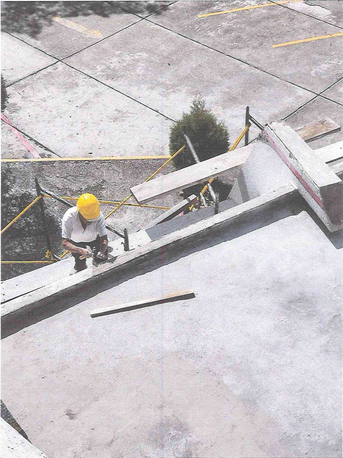
TRABAJOS DE LIMPIEZA Y LIBERACIÓN DE AGREGADOS EN PARTE SUPERIOR DEL INGRESO DEL TEATRO DE CÁMARA – SEGMENTO TC