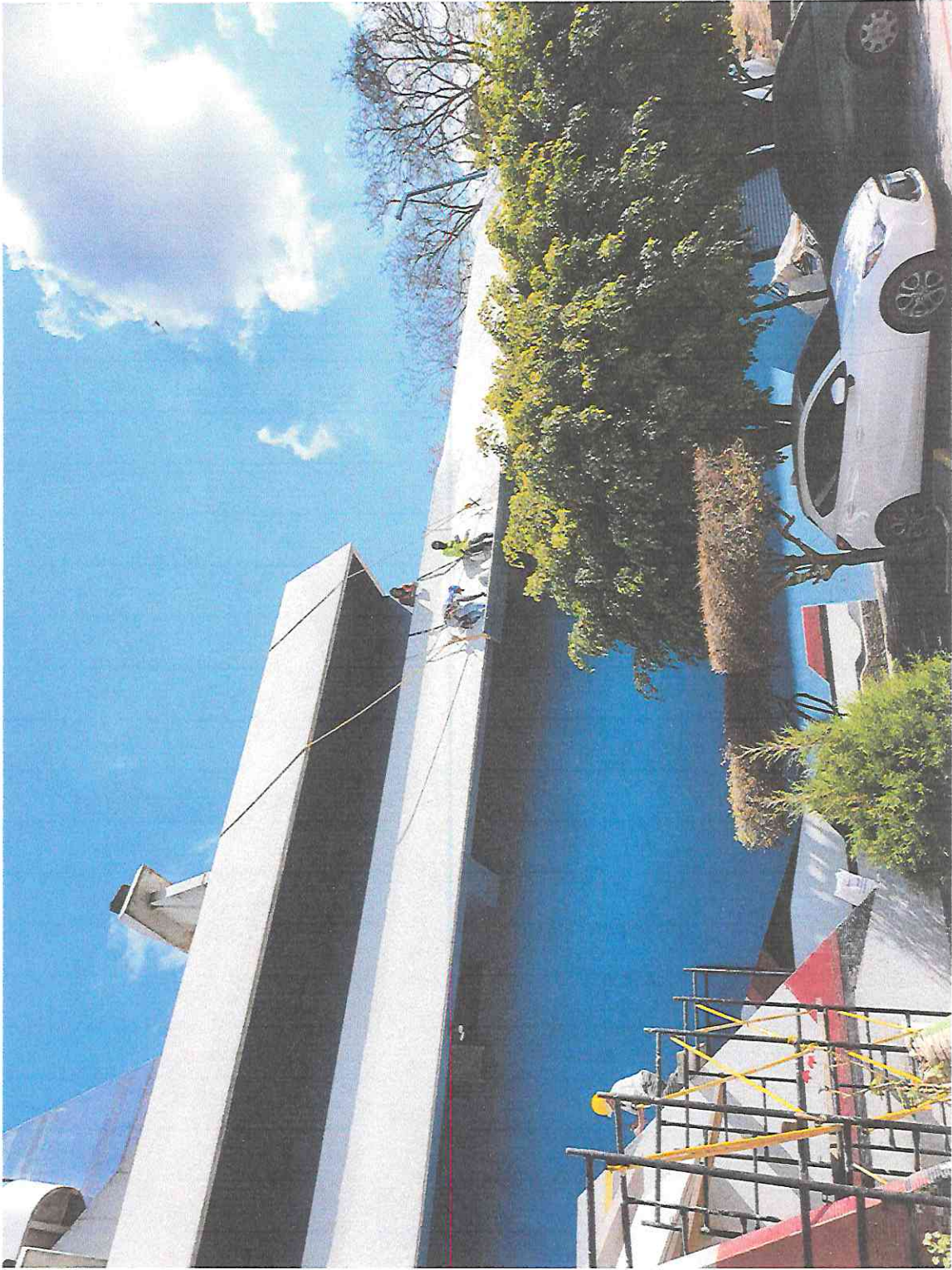
TRABAJOS DE LIMPIEZA Y LIBERACIÓN DE AGREGADOS EN INGRESO DEL TEATRO DE CÁMARA – SEGMENTO TC